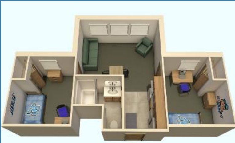
UN APARTAMENTO DE DOS DORMITORIOS