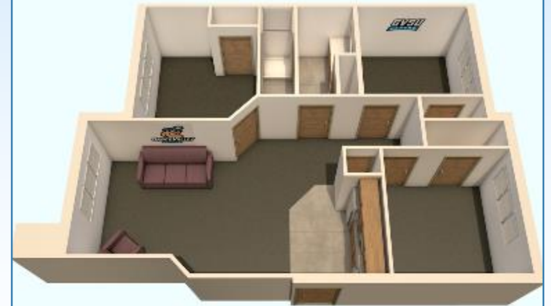
EN EL CENTRO 3-DORMITORIOS