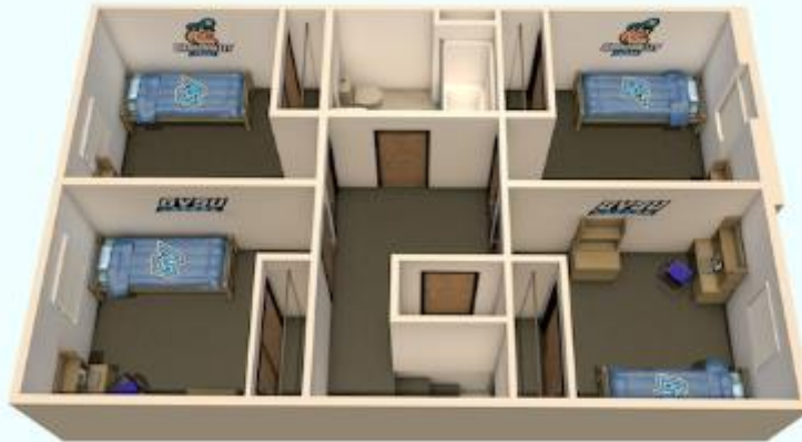
TOWNHOUSE – LA SEGUNDA PLANTA