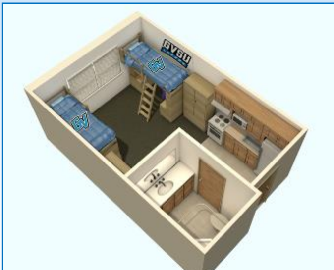
UN APARTAMENTO DE UN DORMITORIO