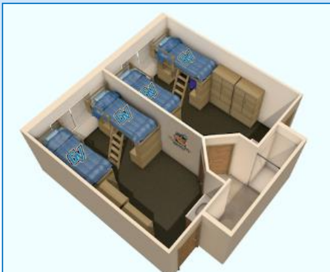
UN APARTAMENTO DE DOS DORMITORIOS

* TODAS LAS CAMAS EN EL CAMPUS TIENEN COLCHONES INDIVIDUALES EXTRA LARGOS.