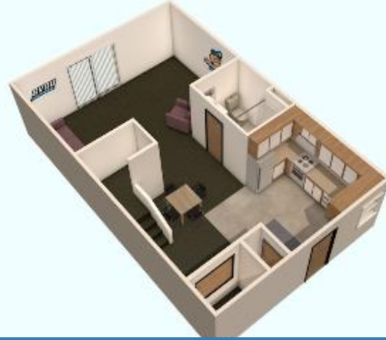
TOWNHOUSE – LA PLANTA BAJA