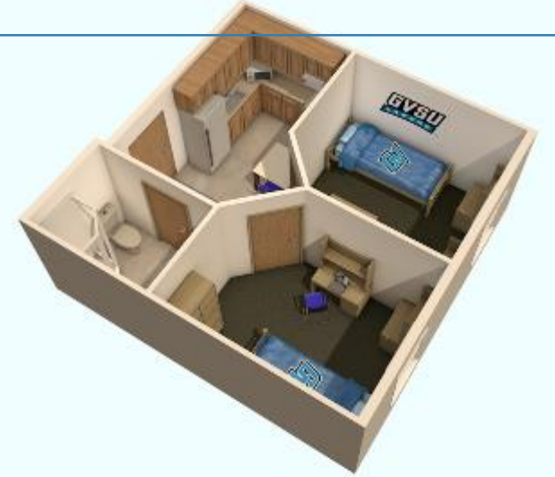
EN EL CENTRO DOS DORMITORIOS