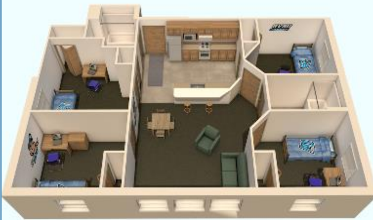
UN APARTAMENTO DE 4 DORMITORIOS