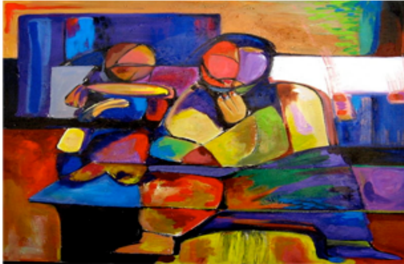
"The Dominican Republic" por Erick Pichardo

Este no fue la última vez que Pichardo experimentó una diferencia de opinión en cuanto al arte durante su tiempo aquí en EE.UU. Hoy en día experimentó la rabia de la discriminación aquí muy cerca de nosotros en el oeste de Michigan debido a su herencia africana. Al descubrir que su arte es influenciado por los africanos y los Tainos (los indígenas de la República Dominicana), había muchas veces que algunos posibles compradores lo despiden lo más rápido que pudo aunque sus retratos son creativos, bien coloreados, y bellos. También, un religioso le dijo que sus dibujos incluyen elementos de brujería en cuanto a la influencia africana utilizada por Pichardo.